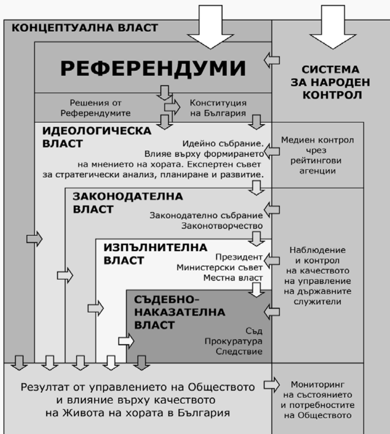
Фиг. 2. Модел на управление чрез народовластие в България